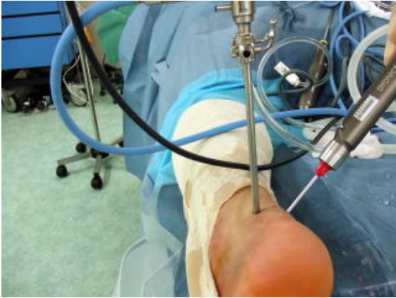
図3A：腹臥位で関節鏡を用いて手術を行います。

アキレス腱の両サイドに約7～8mm程度の皮膚切開を2つ作成して関節鏡を用いて手術を行います（図3A-C）。レントゲンにて三角骨が摘出できたことを確認して手術終了です（図4A,B）