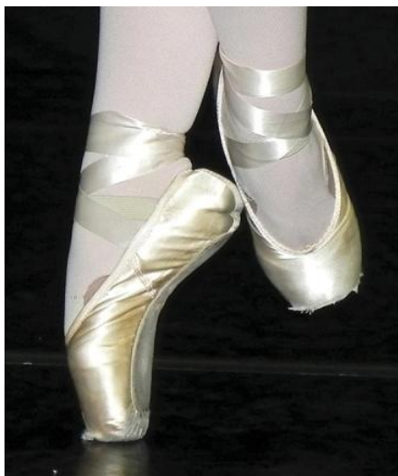
図2：足関節底屈（バレエダンサー）